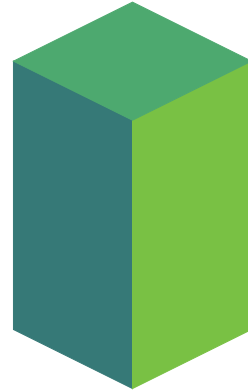
Aprender a Fazer

Essa aprendizagem se refere à aquisição dos "instrumentos do conhecimento", desenvolvendo nos alunos o raciocínio lógico, a capacidade de compreensão, o pensamento dedutivo e intuitivo e a memória. O importante é não apenas despertar nos estudantes esses instrumentos, como motivá-los a desenvolver sua vontade de aprender e querer saber mais e melhor.