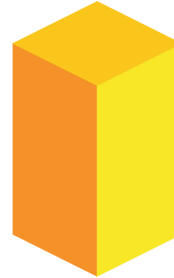
Aprender a Conviver

Essa aprendizagem confere ao aluno uma formação em que aplicará na prática seus conhecimentos teóricos. É essencial que cada indivíduo saiba se comunicar através de diferentes linguagens, assim como interpretar e selecionar quais informações são essenciais e quais podem ajudar a refazer opiniões e serem aplicadas na maneira de se viver e de redescobrir o tempo e o mundo.